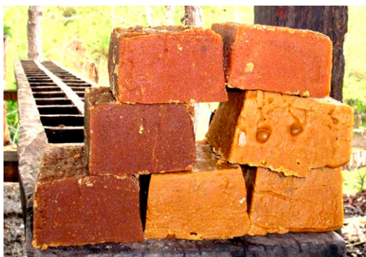
Izquierda: Panela morena Derecha: Panela blanca Arriba: Panela colorada

Los actores principales de este eslabón son los intermediarios, las tostadoras de café, los supermercados y las empresas de rosquillas; todos ellos compran panela para diversos fines. En el territorio existen 10 intermediarios que compran entre 8 a 24 Córdobas/Atado; cada uno tiene una demanda promedio de 600 a 1,000 atados semanales. El transporte lo hacen por bus a un costo de 1.50 Córdobas/Atado. El empaque es en sacos (5 Córdobas/saco). Existen cinco calidades demandadas, el amarillo, colorado, blanco, moreno y negro; los más demandados son amarillo y colorado. El consumidor final paga entre 15 a 28 Córdobas/Atado.