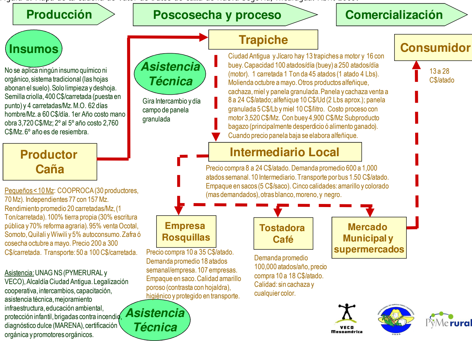
Figura 1. Mapa de la Cadena de Valor de Dulce de Caña de Nueva Segovia, Nicaragua. Abril 2009.